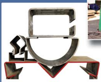
Piegatrice 5000 x 310 ton.