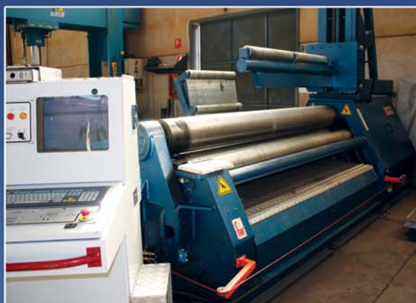
Calandra CNC 2500 x 15

La Tre rulli invece sempre sulla lunghezza di 2500 sul diam. interno 700 sp.20 con invito e diam. interno 1500 sp.30 senza invito.