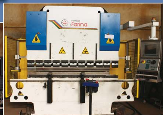
Piegatrice 2000 x 80 ton.