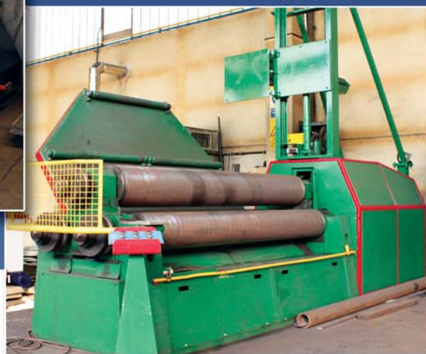
Calandra 2500 x 30